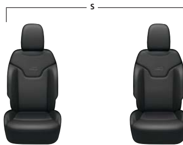
CZARNA SKÓRA ZE SZWAMI DIESEL GREY